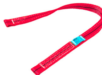
Art. 031108001001 FAST FÖRTÖJNING

Fast förtöjning 1,4 m (röd). För användning i ett positionerings- eller fallskyddssystem.