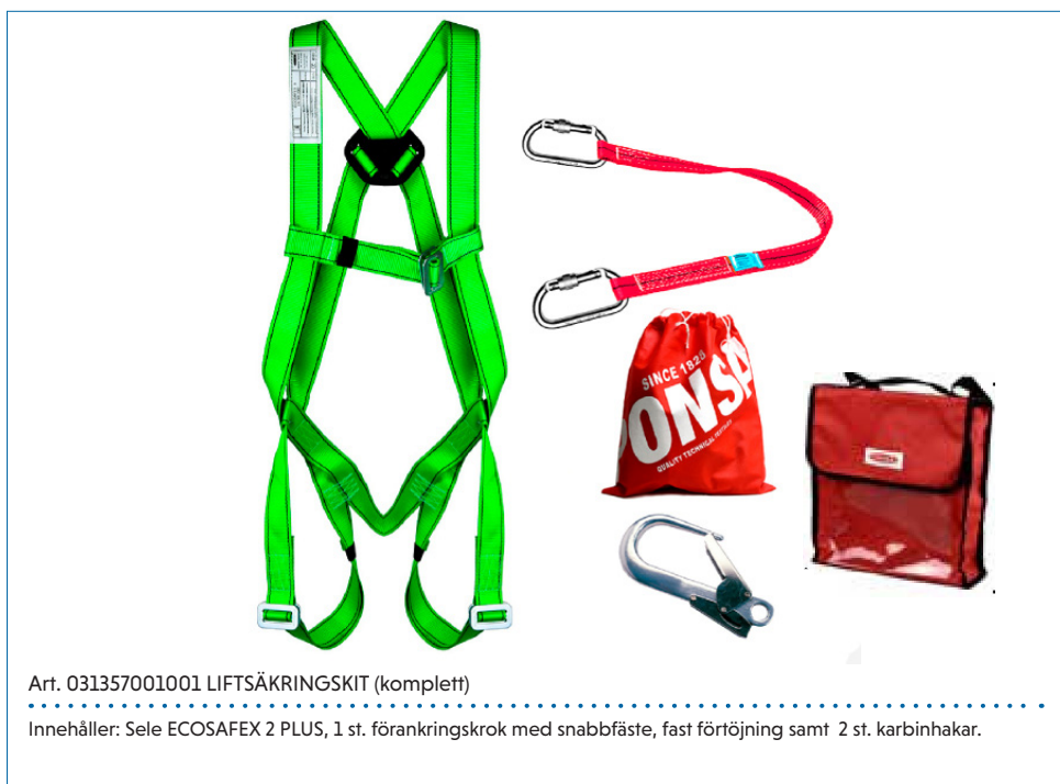
Art. 031357001001 LIFTSÄKRINGSKIT (komplett)

Innehåller: Sele ECOSAFEX 2 PLUS, 1 st. förankringskrok med snabbfäste, fast förtöjning samt 2 st. karbinhakar.