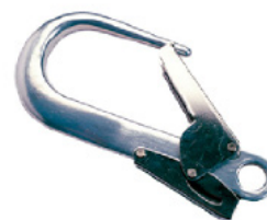
Art. 022087001001 FÖRANKRINGSKROK MED SNABBFÄSTE

Längd: 220mm x Bredd: 120mm Öppning: 50 mm 22kN