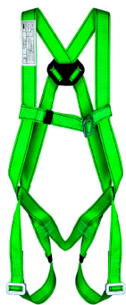
Art. 031010001001 SELE ECOSAFEX 2 PLUS